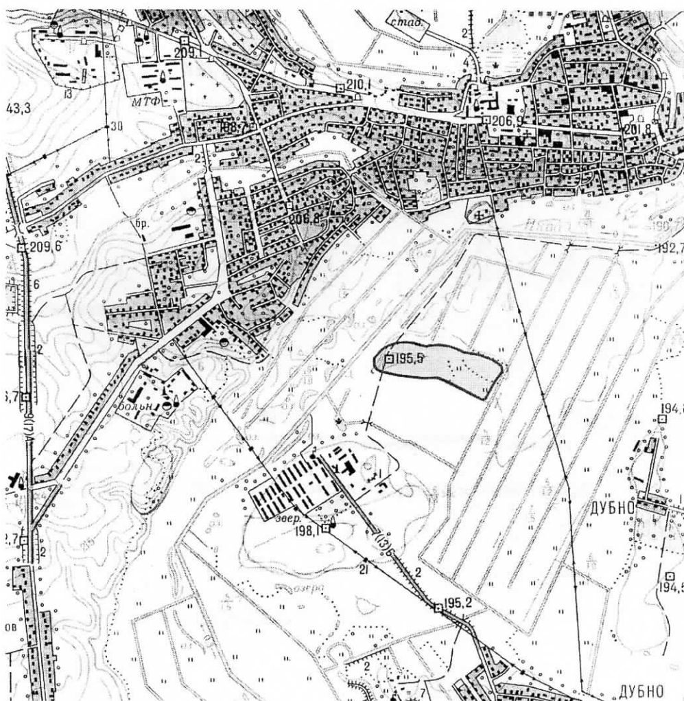
Мапа з зазначеним місцем реалізації проекту